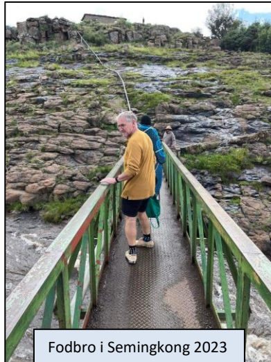
Fodbro i Semongkong 2023