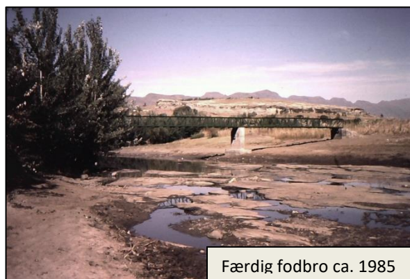
Færdig fodbro ca. 1985